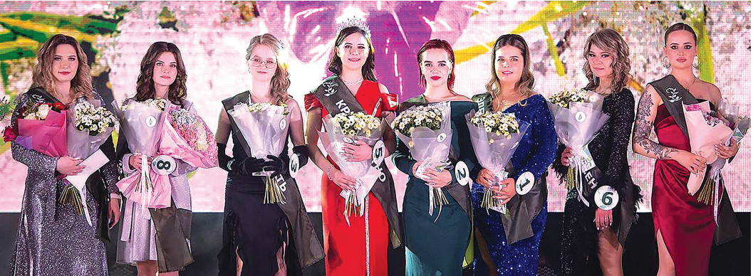
Участницы конкурса «Краса СИТНО-2025»

Финал конкурса состоится 6 марта, накануне Международного женского дня, на сцене досутового центра «СИТНО» по адресу: ул. Лазника, 19. Приглашаем всех желающих увидеть яркое шоу своими глазами и поддержать наших прекрасных участниц.